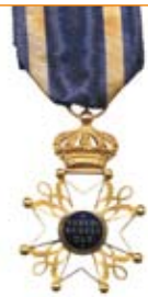
Orde van de Nederlandse Leeuw, ridder