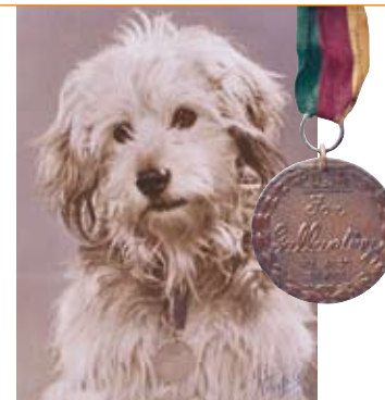
De hond Ricky, met de Dickin-Medal hangend aan zijn halsband