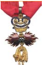
Orde van het Gulden Vlies