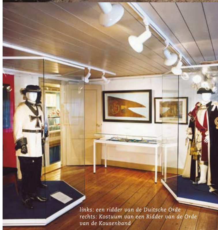
links: een ridder van de Duitse Orde rechts: Kostuum van een Ridder van de Orde van de Kousenband